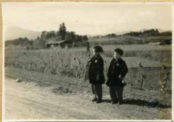
群馬県の学童集団疎開先にて