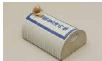
国策湯丹保（こくさくゆたんぼ）