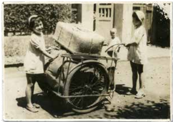
学童集団疎開の準備 家から駅まで荷物を運ぶ

この展覧会では、これまでに館へ寄贈された、戦時下の生活の様子が伝わる実物資料を展示し、時代を生きた人々の暮らしを振り返ります。