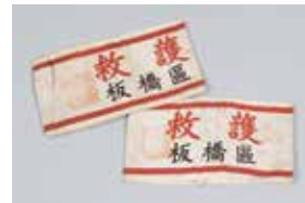
戦時中医療器材等