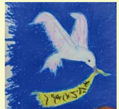
木島始 詩画集「もぐらのうた」表紙原画 1970年頃 当館蔵

今年度の分室常設展示の木島始コーナーに、創作メモや推敲のあと、自筆の挿絵原画などを展示します。のぞいてみてください。