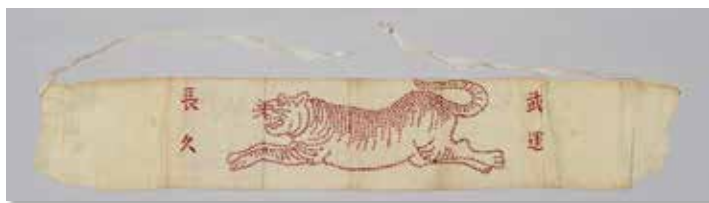
千人針（大勢の人が一针ずつ刺して出征する兵士にお守りとして贈ったもの）