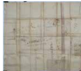
江古田付近の手書きの地図