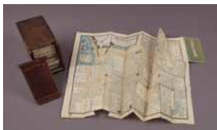
江戸切絵図(嘉永年間)

また、練馬区域も印刷されている。大正期から昭和20年代までの地図も展示します。現在との比較をしてみると面白いかもしれません。