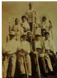
丸吉講高松講社 富士山登頂記念 昭和32(1957)年撮影

噴火を繰り返していた頃の富士山、江戸・東京の人々と富士山との関わり、富士信仰の流行と練馬の富士講、受け継がれる富士信仰と観光地としての富士のテーマに分け、地誌や記録などの文献資料、『富嶽三十六景』や『不二三十六景』などの浮世絵、黄表紙や滑稽本などの版本、練馬区内や山梨県富士吉田市の御師宅に残る富士講装束や富士講による奉納物などの民俗資料を展示します。