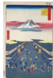
名所江戸百景 するかてふ (足立区立郷土博物館蔵)