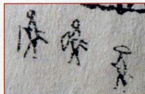
① 武士と武家奉公人