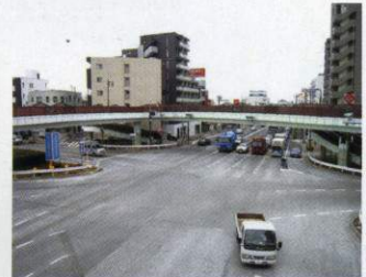
谷原交差点 昭和25年頃(写真左)と 現在(写真上)