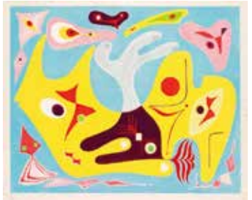
《鬼ごっこ》1955年 木版・紙