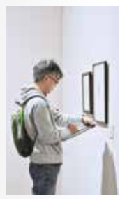
用意されたワークシートにゴリーの特徴を模写していきます。