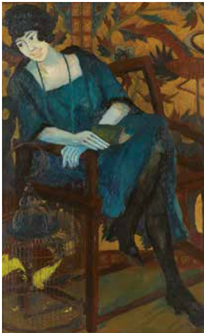
《婦人と金絲雀鳥》1920年 油彩・キャンバス 東京国立近代美術館

夏目漱石との交友で知られる画家津田青楓(1880～1978)の初の大規模な回顧展です。漱石、経済学者河上肇、そして良寛と、津田がもっとも影響を受けた3人を軸にし、作品や関連資料約250点を通して、明治・大正・昭和の時代を生きた津田青楓の生涯を振り返ります。