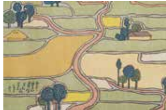
図案集『うづら衣』より 1903年 個人蔵