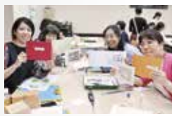
詩画集の表紙と綴じ糸は好きな色を選んだので、さらに愛着がわきます。