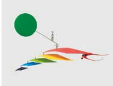
《サソリ》1968年 メラミン塗装・アルミ板、針金ほか