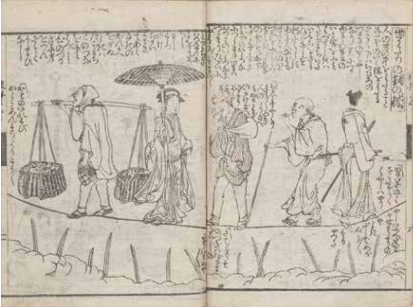
彼岸櫻勝花談義(ひがざくらのはなよりだんざ) 寛政11(1799)年 曲亭馬琴作・北尾重政画 慶應義塾図書館蔵

観覧料 一般300円、高校・大学生200円、65～74歳150円、中学生以下および75歳以上無料、その他各種割引あり (一般以外の方は年齢等の確認できるものをお持ちください。) ◎練馬区立美術館で開催の展覧会との相互割引あり