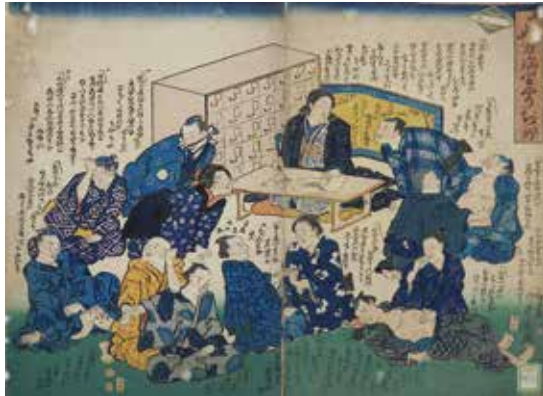
一世の中万病りやうち所