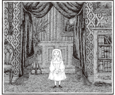
There was once a little girl named Charlotte Sophia.

協力 Edward Gorey Charitable Trust、Brandywine River Museum、株式会社 河出書房新社 後援 一般社団法人日本国際児童図書評議会(IBBY) / 企画協力 株式会社イデッ