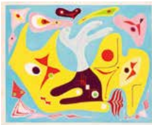
《鬼ごっこ》1955年 木版・紙

品川工(1908～2009)は、新潟県柏崎市に生まれ、練馬区に居住したゆかりの作家です。版画・オブジェの作品展示だけでなく、その素材を探り、解体・解説し、品川の原点である「素材」との出会いから発する造形表現の軌跡を辿ります。