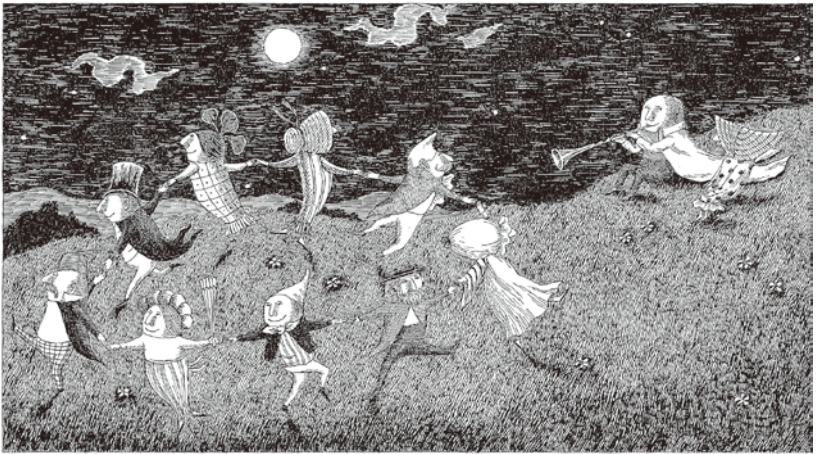
《輝ける鼻のどんく》1969年 挿絵・原画 ペン・インク・紙 エドワード・ゴリー公益信託 ©2010 The Edward Gorey Charitable Trust