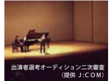
出演者選考オーディション二次審査

練馬区新人演奏会は、有望な新進演奏家を発掘し育成するとともに、広く活躍する契機になることを目的に、練馬区と（公財）練馬区文化振興協会が共催して実施している普及・育成プログラムです。出演者選考オーディションにより決定した出演者がソリストとして演奏会に出演します。声楽・木管楽器・弦楽器の3部門と金管楽器・ピアノの2部門を隔年で実施しています。