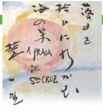
俳句色紙「落日を拾ひに行かむ海の家」

11月10日(日) 13:30～16:40 / 石神井松の風文化公園管理棟2階多目的室 / 対象 中学生以上 / 定員 60名(多数の場合は抽選) / 参加費 無料 / 申込 往復ハガキまたはメール / 申込締切 10月23日(水)