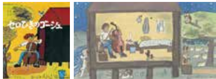
画像左/「セロひきのゴージュ」(文:宮沢賢治 福音館書店 1966年) 画像右/野ねずみの病気を治すゴージュ(「セロひきゴージュより」) 1956年 ちひろ美術館蔵