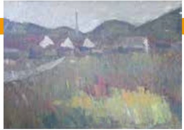
《風景》1955-56年 油彩・キャンバス 個人蔵