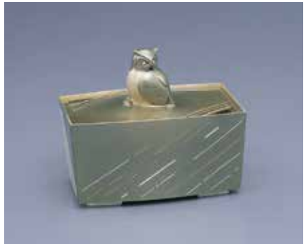
《木宛 香爐》1993年 四分一・赤銅・金・銀 個人蔵