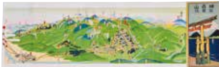
榛名山御案内 昭和2年 陸敏