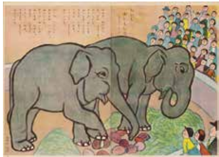
「おもいおしいな」(文:さとう・よしみ「キンダーブック」第8集第7編フレール館 1953年より)