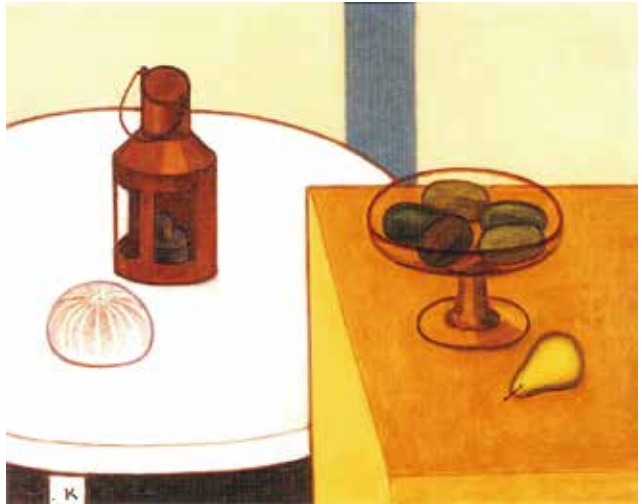
《キウイのある卓上静物》1983年 油彩・キャンバス 個人蔵