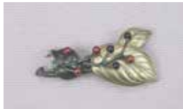
《磯の木 帯留金具》1999年 四分一・金・銀・赤銅・銅 東京国立近代美術館工芸館蔵

観覧料 一般300円、高校・大学生および65歳～74歳200円、中学生以下および75歳以上無料、その他各種割引あり(一般以外の方は年齢等の確認できるものをお持ちください。)