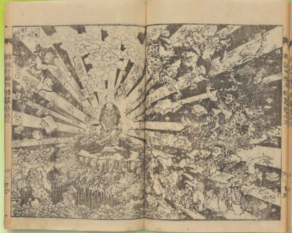
ちんせつうきよかしき 椿説弓張月 文化4(1807)~8(1811)年 曲亭馬琴(作)葛飾北斎(画) 専修大学図書館 蔵