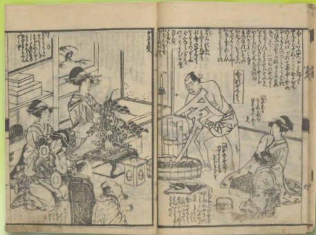
おんなあつらえそのめちようじゆごもん 御詠染長寿小紋 享和2(1802)年 山東京伝(作)喜多川歌麿(画) 明治大学図書館 蔵