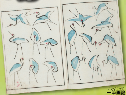
いっぴつがふ 一筆画譜 文政6(1823)年 葛飾北斎(画) 当館 蔵