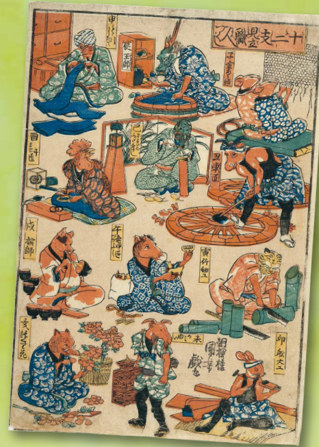
十二支見立職人づくし 江戸時代後期 歌川国芳(画) 東京都江戸東京博物館 蔵