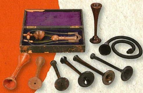
聴診器 国立科学博物館蔵