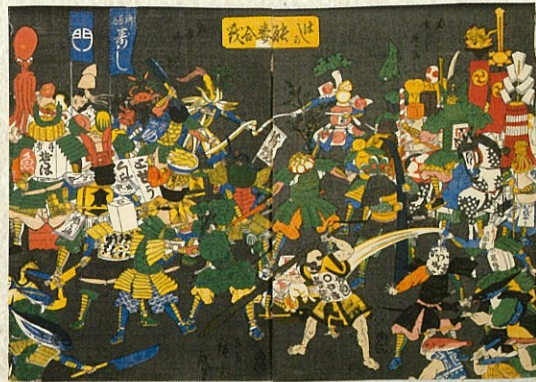
左から 経絡人形 江戸時代 北里大学東洋医学総合研究所蔵