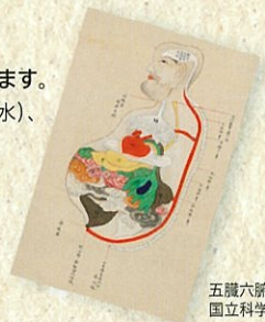
五臓六腑図 国立科学博物館蔵

日時：9月29日(日)、10月23日(水)、 11月4日(月・休) 各回14時から45分程度 会場：石神井公園ふるさと文化館 企画展示室内 定員：なし 参加費：当日の観覧券が必要 申込：不要