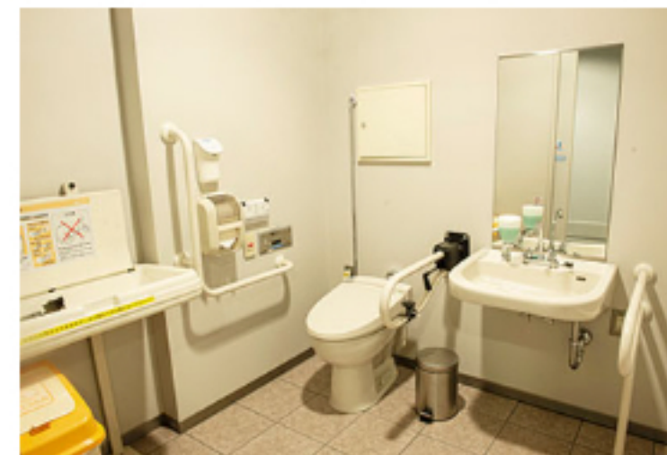
バリアフリースイレ