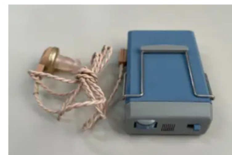
ヒアリングループ受信機

▲ 磁気コイル（Tモード）付補聴器、人工内耳（Tマーク）の方は、お持ちの機器をTモードにさせていただくことで利用できます。